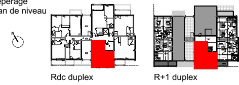
Repérage Plan de niveau