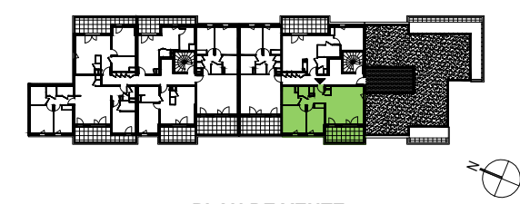
PLAN DE VENTE